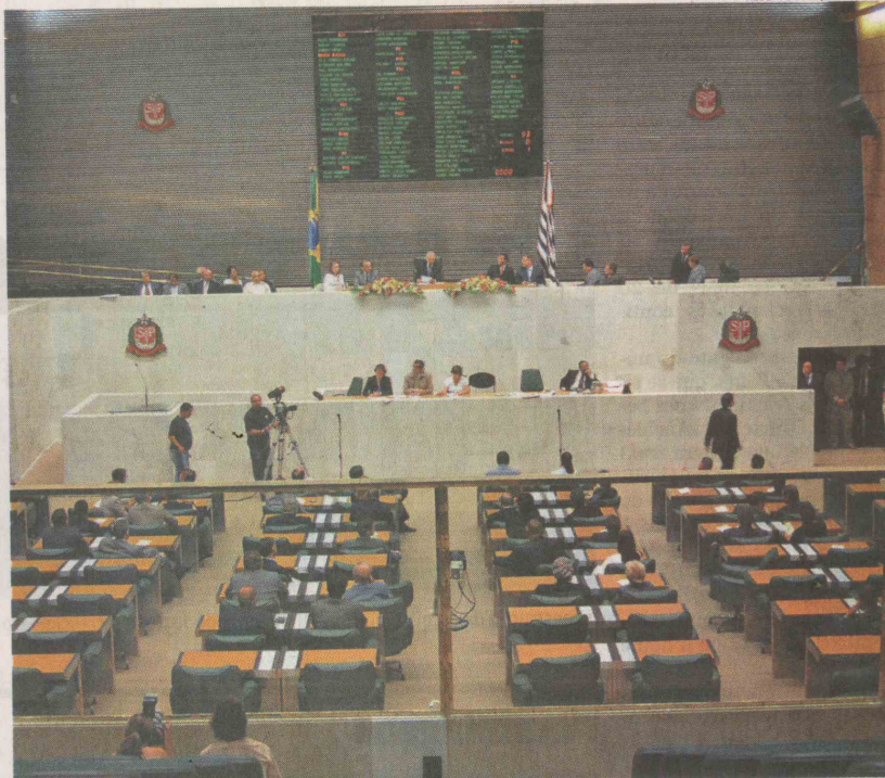
A atual lista de candidaturas impugnadas contém 21 postulantes à Assembleia Legislativa de São Paulo

A pouco mais de dois meses do pleito, os partidos e coligações