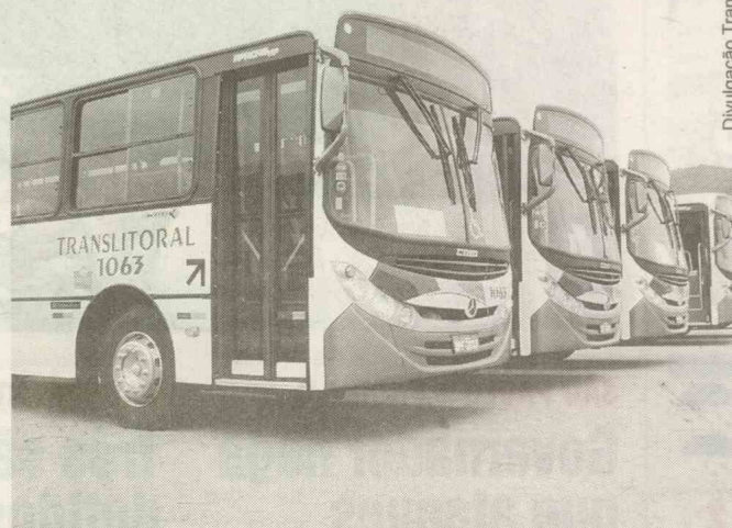
Segundo a Prefeitura, os novos ônibus são inteiramente adaptados a pessoas deficientes e com mobilidade reduzida

De acordo com a Prefeitura de Guarujá, a entrega destes coletivos faz parte do processo de renovação dos ônibus que servem a RTG e que foi iniciado em 2009, com o objetivo de oferecer uma frota de veículos 100% adaptada aos guarujaenses.